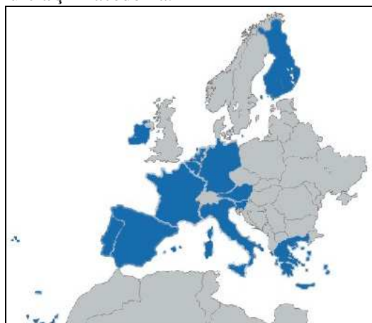
Fig.2 Harta Zonei Euro 10

Practic, în momentul de față, în Europa există grupuri de țări cu „viteze” de integrare diferită [Sută N. (1999)]: grupul Euro 7 : Franța, Germania, Olanda, Belgia, Luxemburg, Austria, Italia, Spania, Portugalia, Finlanda, Irlanda, Grecia și Slovenia 8 ; grupul țărilor non-Euro : Regatul Unit, Danemarca, Suedia; grupul noilor state membre : U.E.-10+2: Cehia, Estonia, Letonia, Lituania, Polonia, Slovacia, Slovenia, Ungaria, Cipru, Malta și, Bulgaria și România; grupul țărilor candidate : Albania, Bosnia și Herțegovina, Montenegro, Serbia, Kosovo; grupul țărilor care vor aparține unui nou val al extinderii 9 : Croația, Turcia și Macedonia.