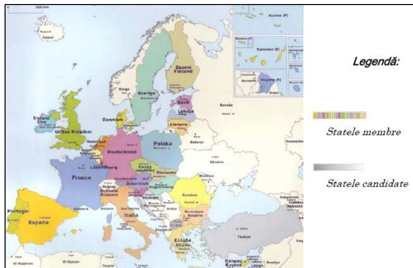
Fig.1 Harta Uniunii Europene în contextul procesului de extindere 5

În 1957, cele șase națiuni făceau parte din trei comunități CECO, CEE și Euroatom. Cele trei Comunități aveau un Parlament unic, denumit Parlamentul European și o Curte de Justiție unică, denumită Curtea Europeană de Justiție . În acest context, în 1965, s-a considerat necesară unirea celor trei comunități într-una singură, numită Comunitatea Europeană (CE). În anul 1973, a început procesul de extindere al Comunității Europene, după cum urmează: Danemarca, Irlanda și Marea Britanie (1973); Grecia (1981); Spania și Portugalia (1986); Austria, Finlanda și Suedia (1995); Cehia Cipru Estonia Letonia Lituania Malta Polonia Slovacia Slovenia și Ungaria (2004); Bulgaria și România (2007). Prin urmare, pe o suprafață de 4 milioane km 2 U.E. găzduiește aproximativ 500 milioane de locuitori.